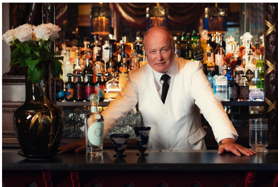
Colin Peter Field

Vente COLLECTIONS , en ligne du 29 février au 13 mars 2024