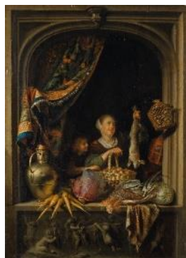
GERRIT DOU (LEIDEN 1613-1675) A young woman holding a hare with a boy at a window

La vente du soir illustre la célèbre esthétique Rothschild. Elle comprend des peintures de Maîtres anciens telles que A young woman holding a hare with a boy at a window de Gerrit Dou (estimation : 3 000 000 – 5 000 000 $) ; du mobilier européen, notamment une paire de fauteuils en bois peint en blanc et doré de la fin de l'époque Louis XV (estimation : 600 000 – 1 000 000 $) et un cabinet en pierres dures sur un piétement en bronze doré (estimation : 200 000 – 300 000 $).